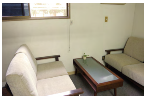
面談などにも使用するミーティングスペース。