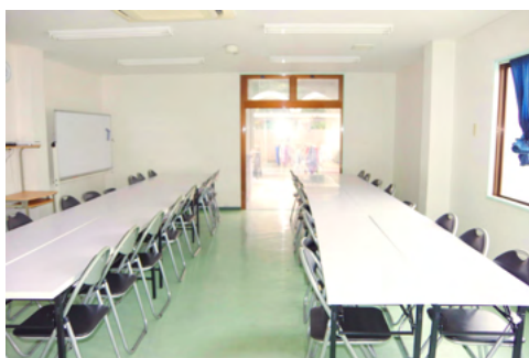
講習や食堂としても使用可能な教室。合計 3 部 屋完備しております。