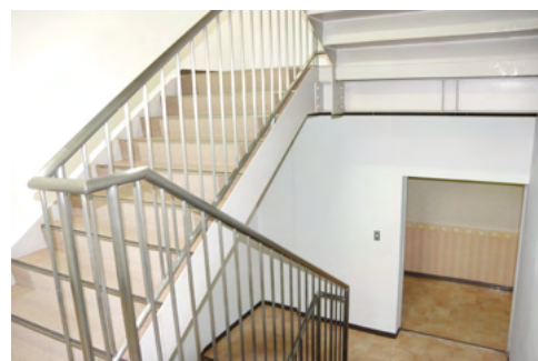
各部屋へのアクセスが容易で避難経路としても 明確な導線がひかれています。